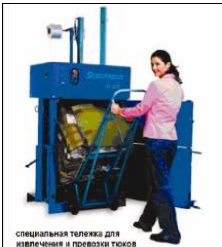
специальная тележка для извлечения и перевозки тюков